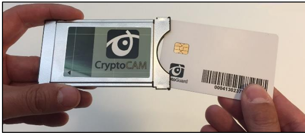
Ex: Programkort i CA-modul.