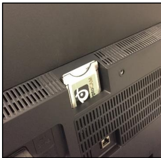
Ex: Inbyggd box i TVn. CA-modul och programkort monterat i TVn. Andra tv- apparater kan ha sin plats (CI, Common Interface) placerad på annat ställe.

Följ installationsmanualen för digitalboxen eller CA-modulen som du har eller som du köper. Där ser du hur du sätter i ditt programkort. Se också till att du monterar programkortet i digitalboxen eller CA-modulen på rätt sätt, så den fungerar som den ska. Programkortet sätts i platsen för kort och då kodas kanalerna av och du kan se dem som vanligt. Se i tv eller digitalboxens manual hur kortet ska sättas i.