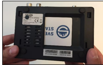
Ex: Programkort i extern digitalbox.